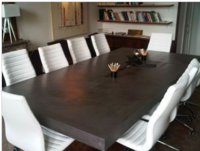
Table de réunion

En parallèle, l'entreprise est également capable d'imaginer des projets sur mesure : aménagement d'espace, création de mobilier... Pour l'aider, elle compte d'ailleurs beaucoup sur l'imagination de Matali Crasset.