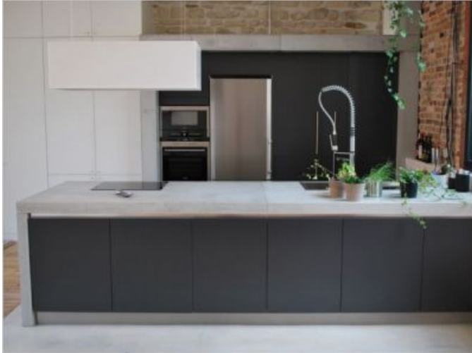
Autre exemple : un plan de travail.