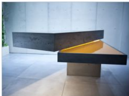
Simon Bouisson - CONCRETE BY LCDA ©

Création en béton fibré imaginée par Matali Crasset pour Concrete.