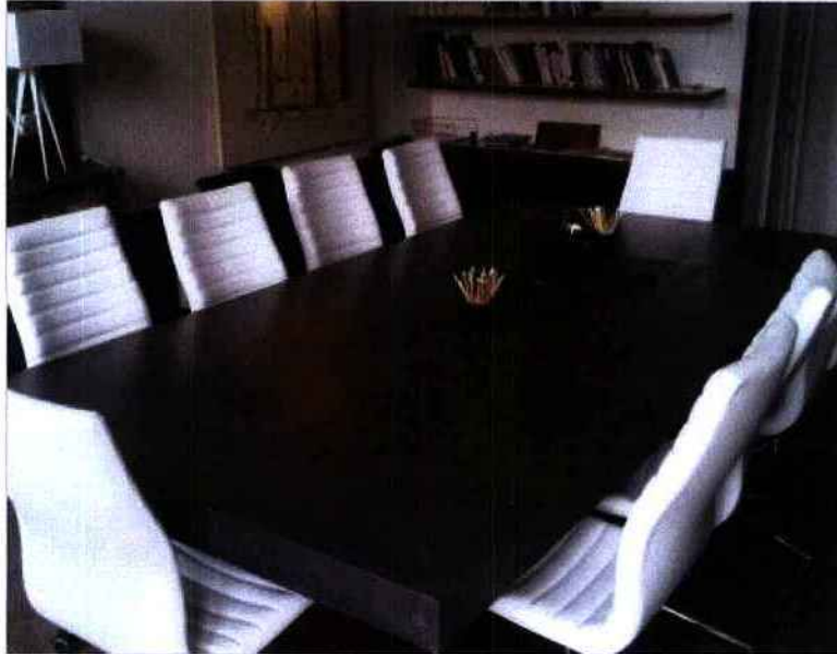
Table de réunion