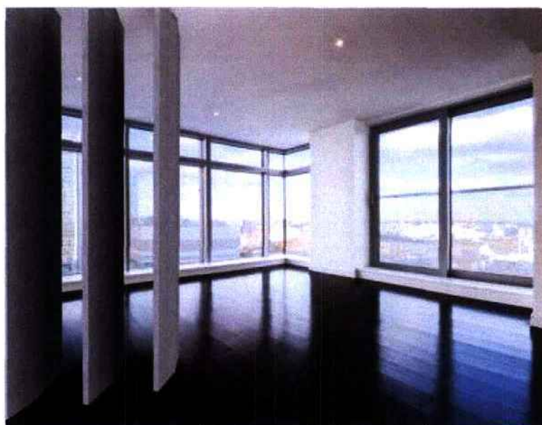
CONCRETE BY LCDA ©

Pour compléter son offre, elle propose également des modules verticaux - les "Modubéton®" - à installer dans une pièce pour séparer deux espaces.