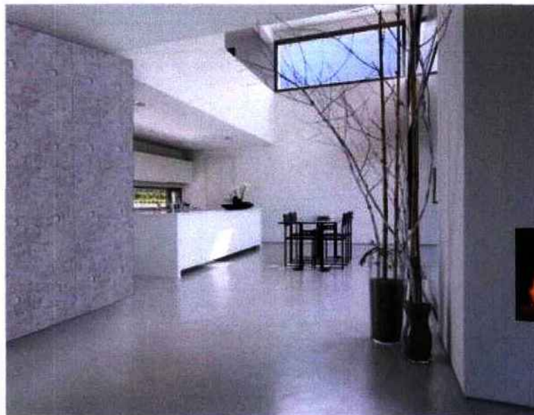
CONCRETE BY LCDA ©

Autre solution d'aménagement intérieur développée par l'entreprise : les "Panbéton®", des plaques de grande dimension à installer en guise de transition entre l'intérieur et l'extérieur.