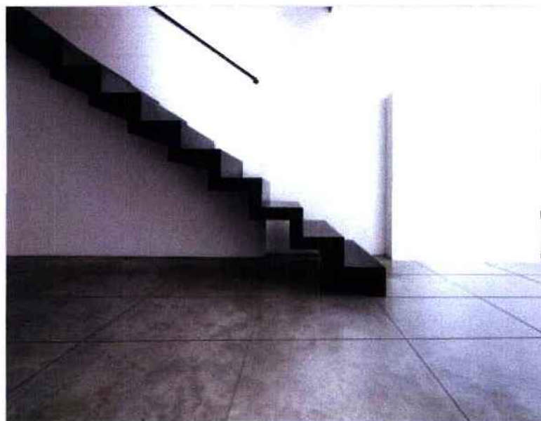
CONCRETE BY LCDA ©

L'entreprise Concrete a mis au point trois solutions prêtes à poser en béton fibré. Ici, les "Dalbéton®", des dalles de grande dimension à installer au sol.