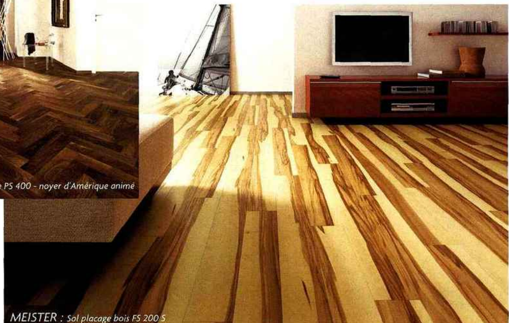
MEISTER : Sol placage bois FS 200 S