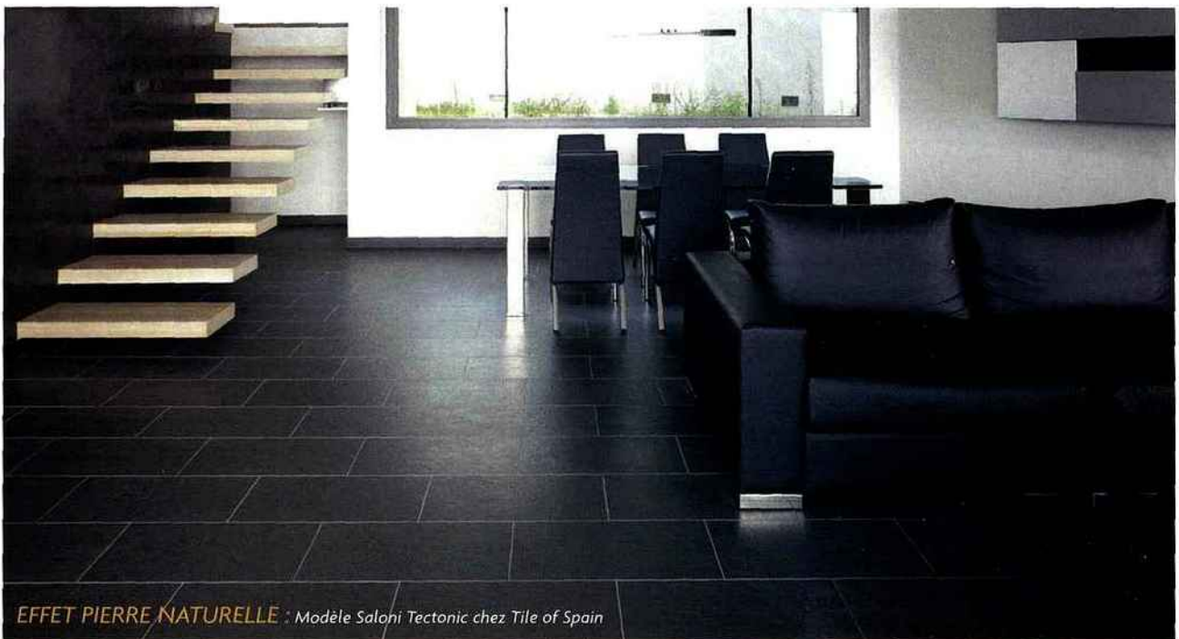
EFFET PIERRE NATURELLE : Modèle Saloni Tectonic chez Tile of Spain

ambiant. En plus d'être durable, ce matériau est en mesure d'interagir avec l'environnement en réduisant la pollution atmosphérique et d'agir efficacement contre certaines bactéries très pathogènes. Bio2Clean® est donc bien plus qu'une nouvelle ligne de produits, elle représente une véritable révolution dans le domaine des matériaux pour les revêtements de sol et murs.