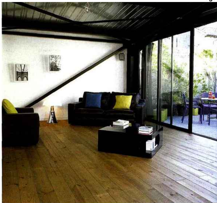
VERNILAND Le modèle Praline, parquet huilé

« Faire de son intérieur un lieu de vie ! » c'est sur cette idée que Syntilor , le spécialiste de la protection, de la décoration et de l'embellissement de tous les bois de la maison, s'attelle à faire évoluer ses produits, en proposant des produits de protection et d'entretien adaptés à toutes les situations. Les huiles, vitrificateurs et sous couches Syntilor répondent ainsi aux besoins de chacun quel que soit son mode de vie, notamment dans ces lieux de passage, où il est difficile d'échapper aux taches, rayures, traces d'eau ou traces de pas.