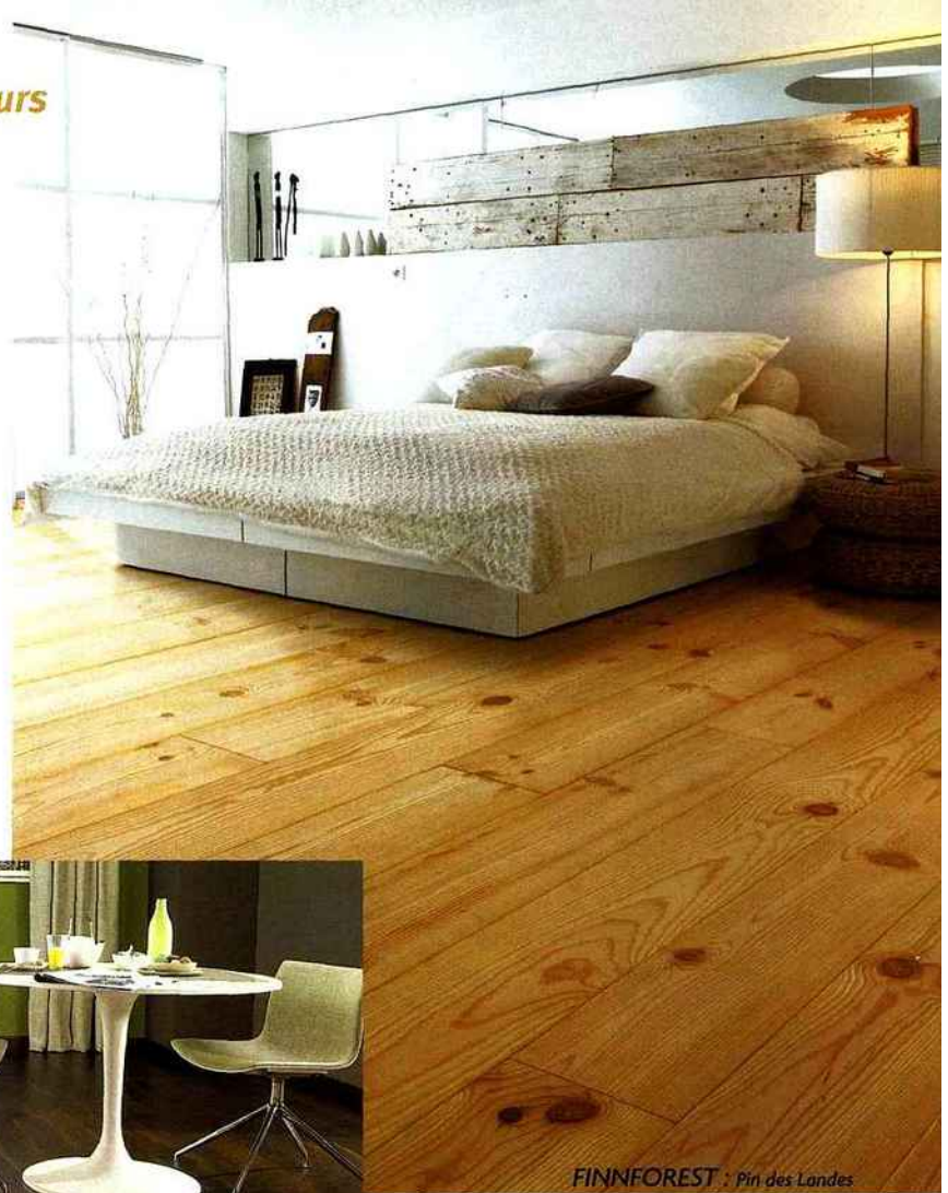
FINNFOREST : Pin des Landes

Une alternative aux bois exotiques est le thermochoauffage associé à une essence locale PEFC permettant d'obtenir toutes les garanties environnementales que ne peuvent apporter nombre de bois africains et asiatiques. Ce traitement naturel assure donc la valorisation et la conservation des bois locaux. Le bois, qui normalement est