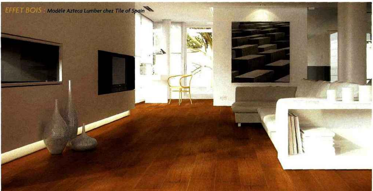
EFFET BOIS : Modèle Azteca Lumber chez Tile of Spain