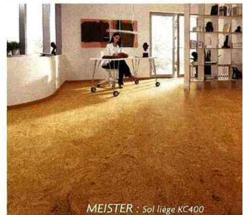
MEISTER : Sol liège KC400