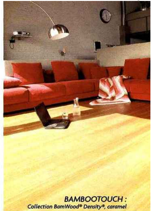
BAMBOOTOUCH : Collection BamWood® Density®, caramel