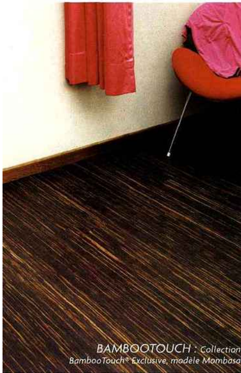
BAMBOOTOUCH : Collection BambooTouch® Exclusive, modèle Mombasa

Depuis de nombreuses années, dans le commerce du bois et des matériaux de construction, la marque Meister cent pour cent made in Germany, est synonyme de produits de qualité exceptionnelle : sols, lambris, accessoires.