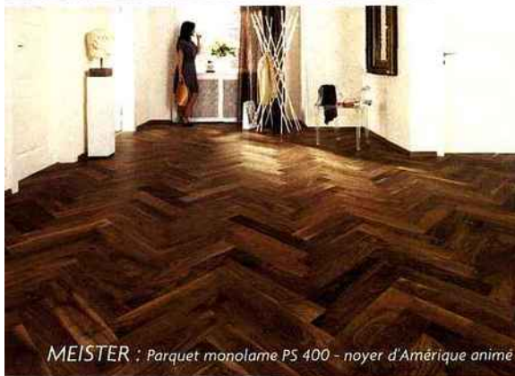
MEISTER : Parquet monolame PS 400 - noyer d'Amérique animé